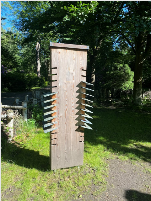
Lärchenstehle mit Schieferplatten

Die Kosten in Höhe von 595,00 € für 20 Jahre sind im Voraus zu entrichten.